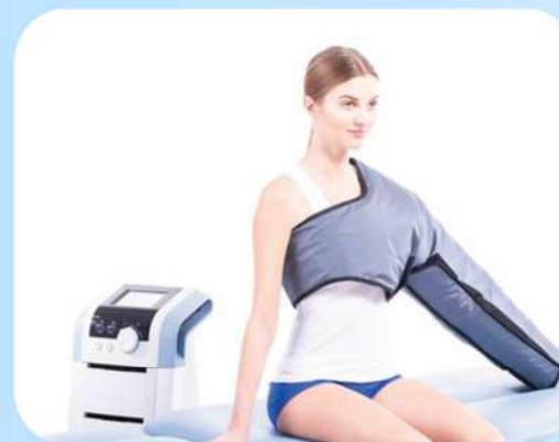
BRAÇO DE 8 CÂMARAS