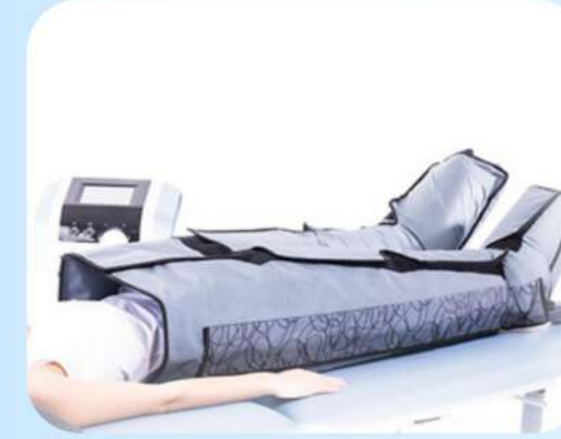
CALÇA DE 24 CÂMARAS VELCRO