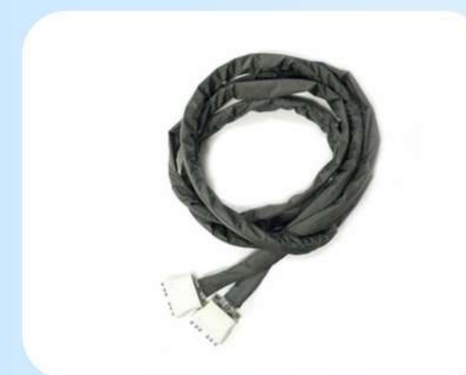
INTERFACE P/ 2 BRAÇOS/PERNAS