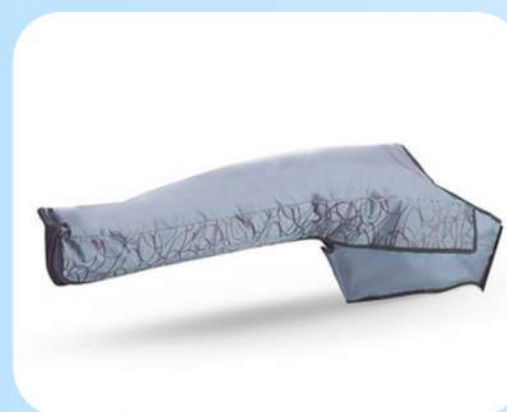
CALÇA DE 24 CÂMARAS FECHADA