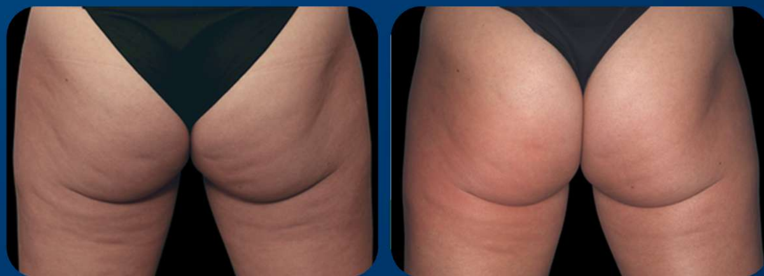
1 MÊS APÓS A ÚLTIMA SESSÃO