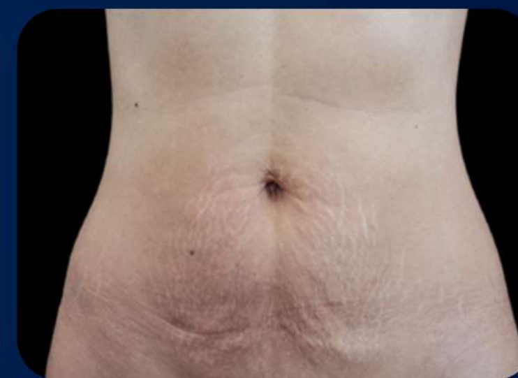
3 MESES APÓS A 4ª SESSÃO