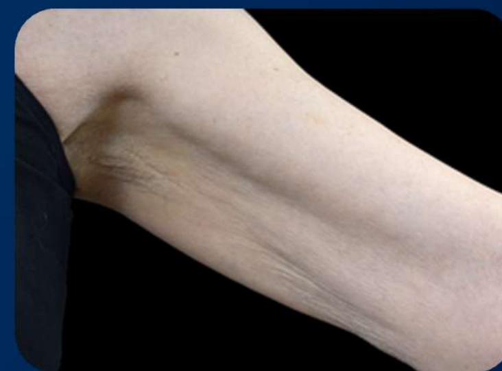
3 MESES APÓS A 4ª SESSÃO