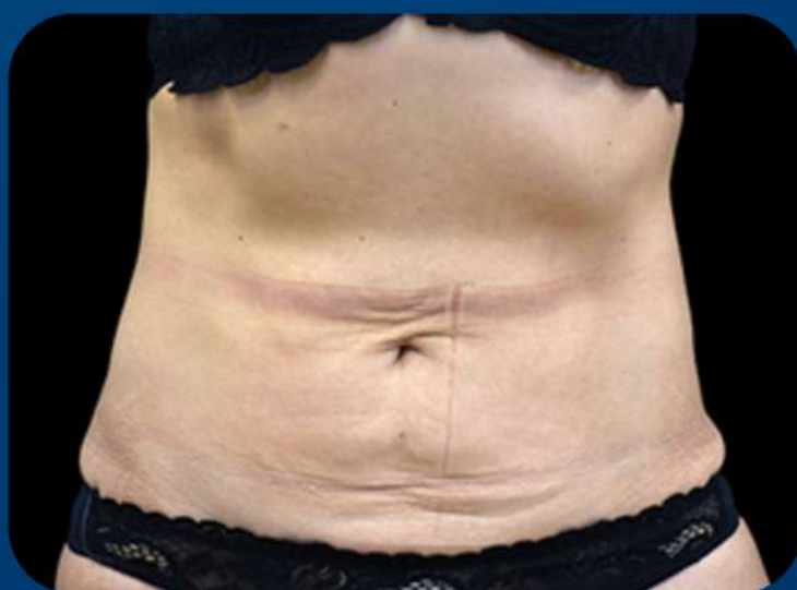
1 MÊS APÓS A 4ª SESSÃO