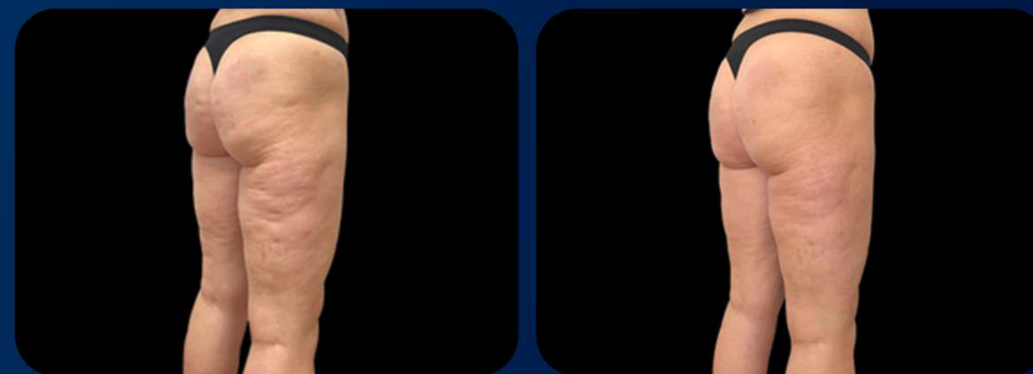
1 MÊS APÓS A 4ª SESSÃO